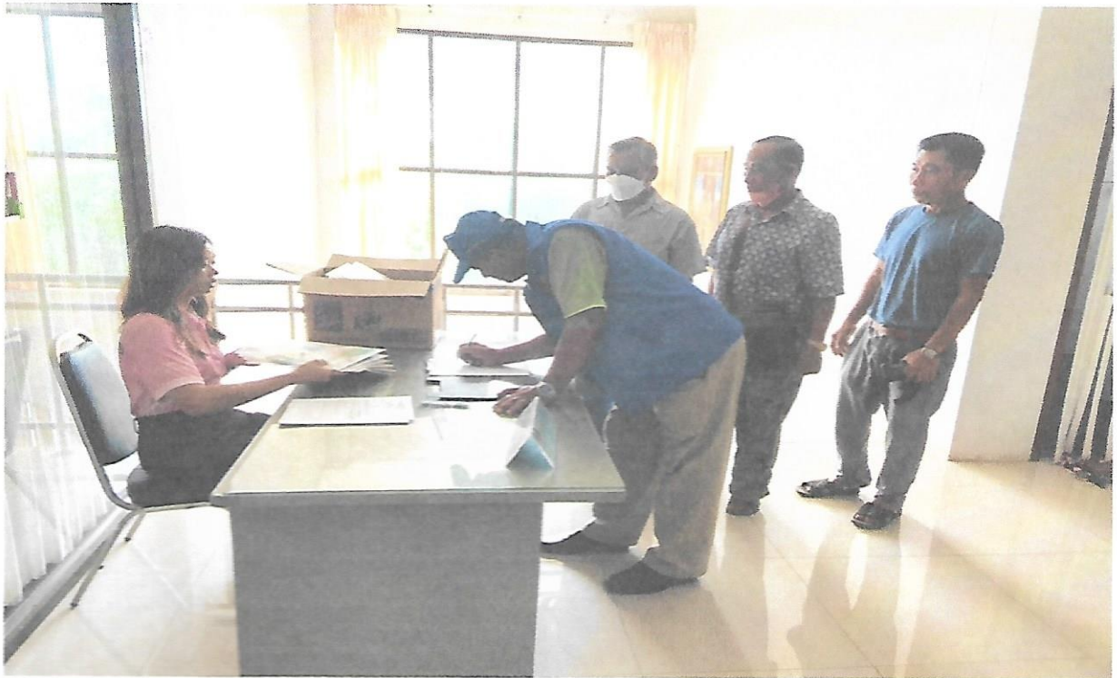
๑. เวลา ๐๘.๐๐-๐๙.๐๐น. ลงทะเบียนของผู้เข้าร่วมอบรมในโครงการฯ